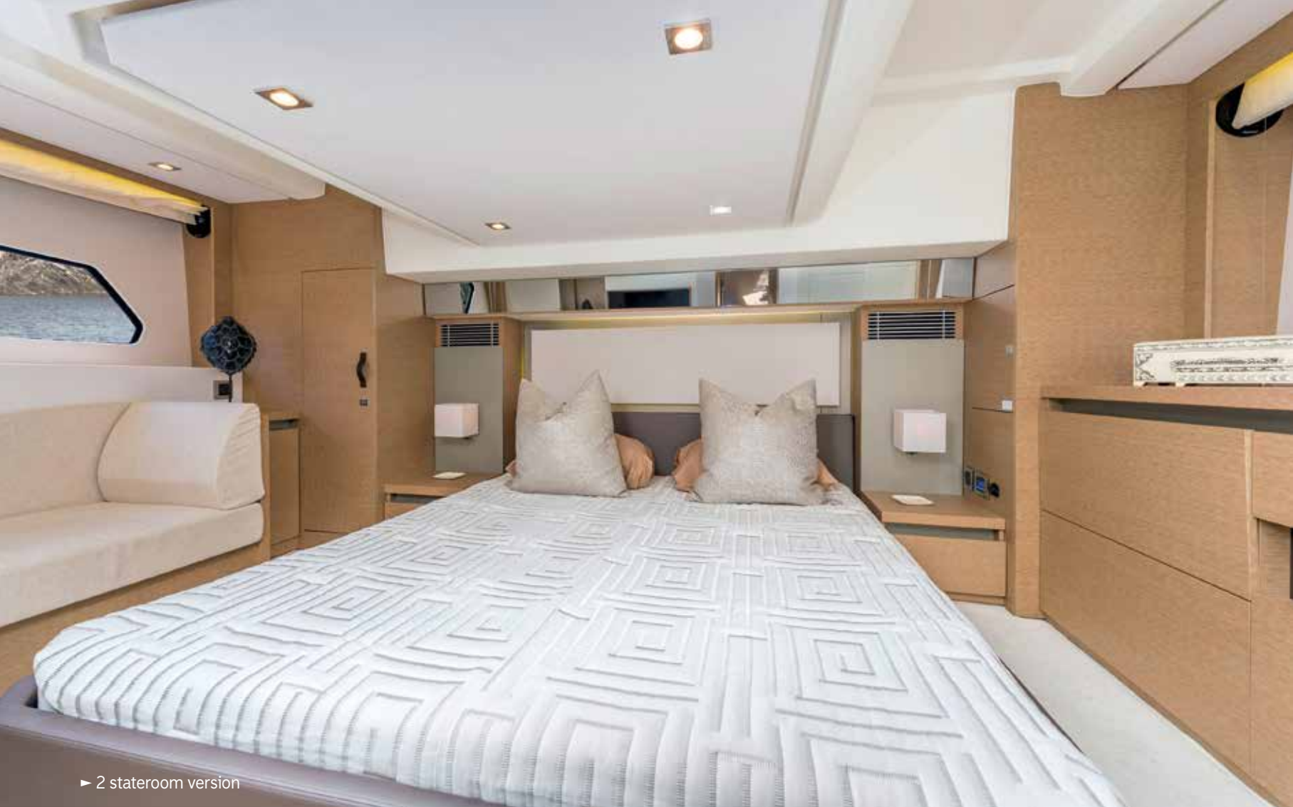
► 2 stateroom version